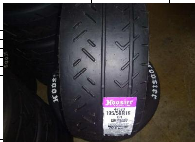
Rallye-Asphalt 15" bis 18" mit E-Kennung