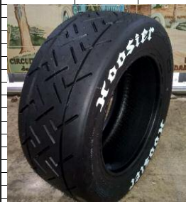
Rallye-Asphalt 13" und 200/580 R 15

Die Schotter-Reifen haben ein asymmetrisches Profil, deshalb gibt es Rechts und Links gebundene Reifen